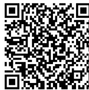
QCR-Code der Weiterbildung

Im Internet: Webseite der Kleintierklinik der FU Berlin (Tierärztliche Weiterbildungen) Bewerbungen richten Sie bitte mit einem kurzen Motivationsschreiben, einem kurz gefassten Lebenslauf, dem Nachweis der tierärztlichen Approbation bis zum 30.07.2015 per E-Mail an: weiterbildung@vetmed.fu-berlin.de .